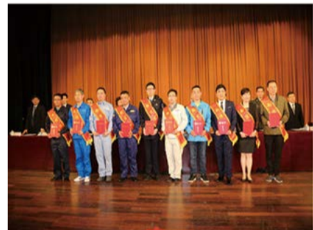
第二批南京工匠上台领奖