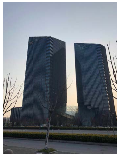
东台农村商业银行电梯采购与服务项目