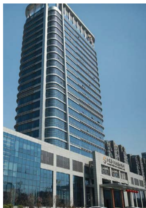
阜宁农村商业银行办公楼智能化项目