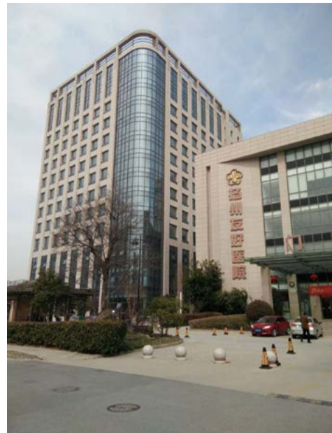
扬州友好医院机电总承包项目